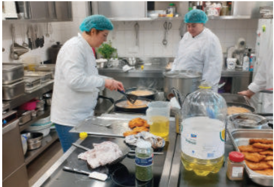
Würzen, panieren und braten. In der Küche der Ma(h)lZeit kocht das Werkkisten-Team.

Gesagt, getan! Der Idee und Anfrage der Ostacker-Frauen stimmte die Werkkiste, Einrichtung für Jugend-Berufshilfe und Quartiers-Arbeit, schnell zu. Dankbar ist die Werkkiste für engagierte Spenderin-