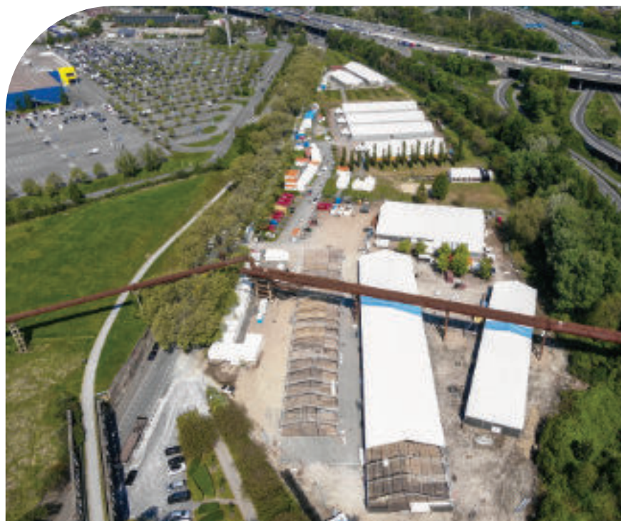
Zelt-Dorf anno 2022. Statt nur am Landschaftspark koordinieren heute stadtwweit die Caritas und drei andere Sozialverbände das Wohn-Angebot für Geflohene.